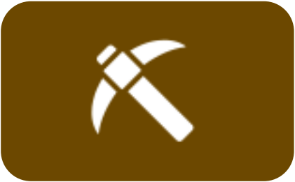
その他保安に関する情報